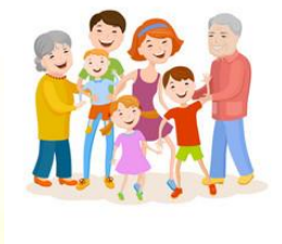
Sdílej čas se svými blízkými