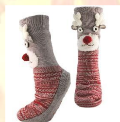
Nos teplé ponožky