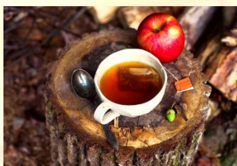
Vypij si svůj oblíbený čaj