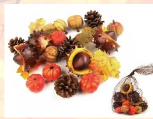
Sbírej podzimní přírodniny