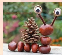
Vyráběj kaštanová zvířátka