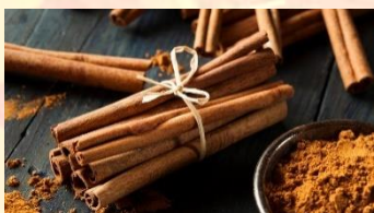
Přivoň si ke skořici