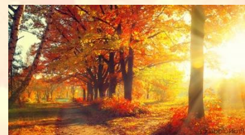
Procházej se podzímem