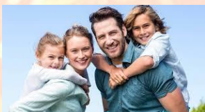
Udělej si s rodinou společnou fotku