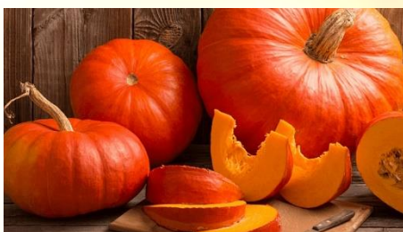
Ochutnej dýňovou polévku